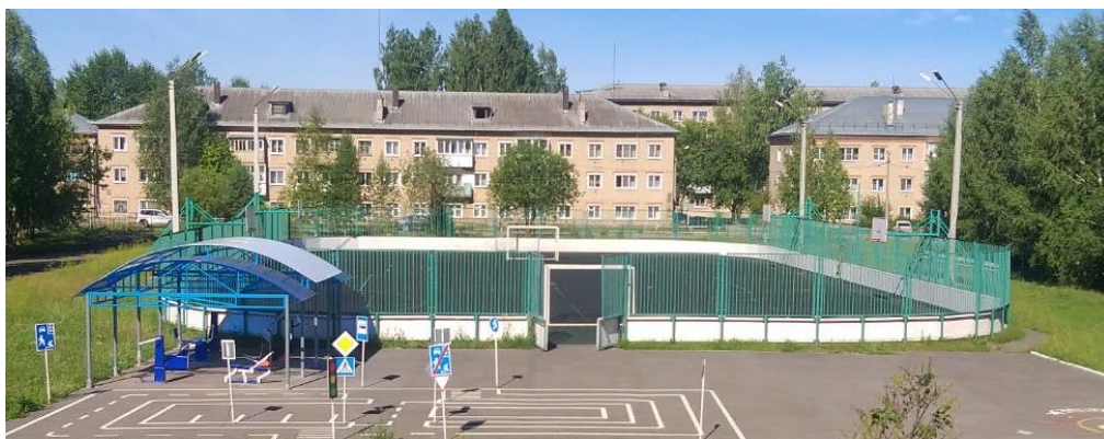
Фото 3. Спортивный стадион, тренажеры

Осуществление активной деятельности, отдыха, занятий физической культурой с целью сохранения здоровья обучающихся в гимназии обеспечивается возможность безопасной и комфортной организации всех видов учебной и внеурочной деятельности.