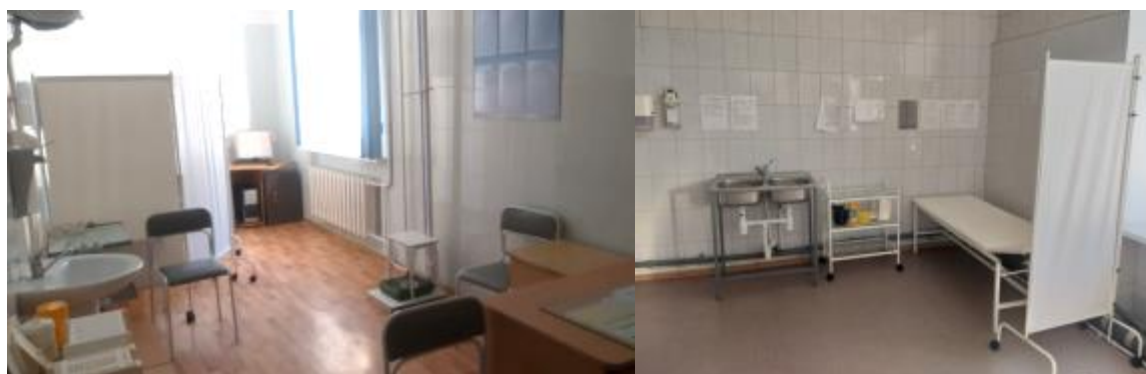
Фото 9. Медицинские кабинеты по ул. Гагарина,21 и ул. Леваневского,21