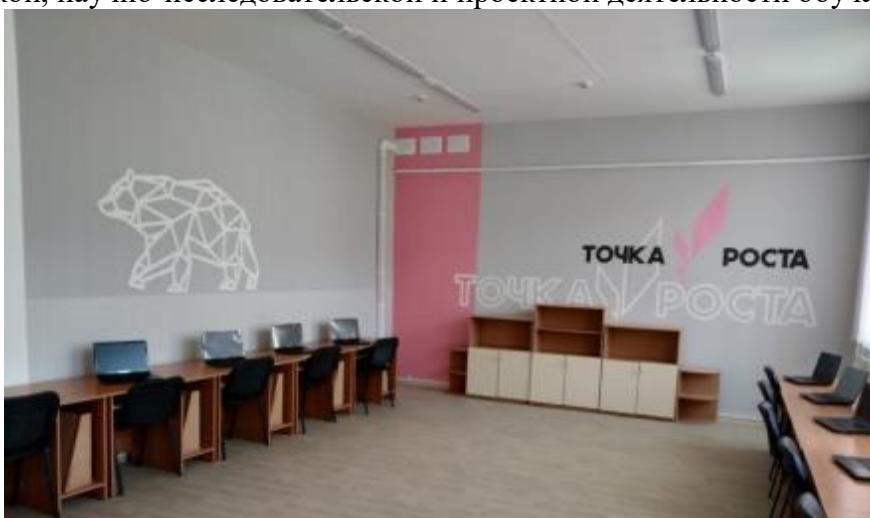
Фото17. Кабинет информатики по ул. Леваневского,21

– доступ к информационно-библиотечному центру, ресурсам Интернета, учебной и художественной литературе, коллекциям медиаресурсов на электронных носителях, к множительной технике для тиражирования учебных и методических текстографических и аудио-, видеоматериалов, результатов творческой, научно-исследовательской и проектной деятельности обучающихся;