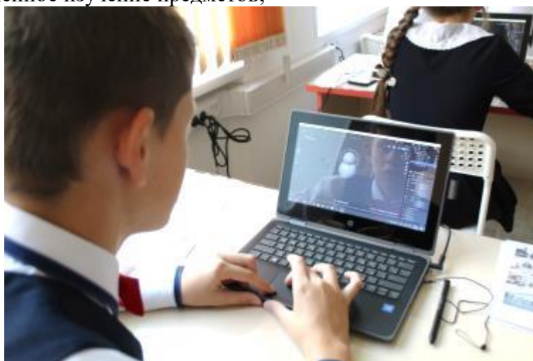
Фото 14. Занятия по промышленному дизайну

– научно-техническое творчество, создание материальных и информационных объектов с использованием 3d-принтера; – получение личного опыта применения универсальных учебных действий в экологически ориентированной социальной деятельности, экологического мышления и экологической культуры; – базовое и углубленное изучение предметов;