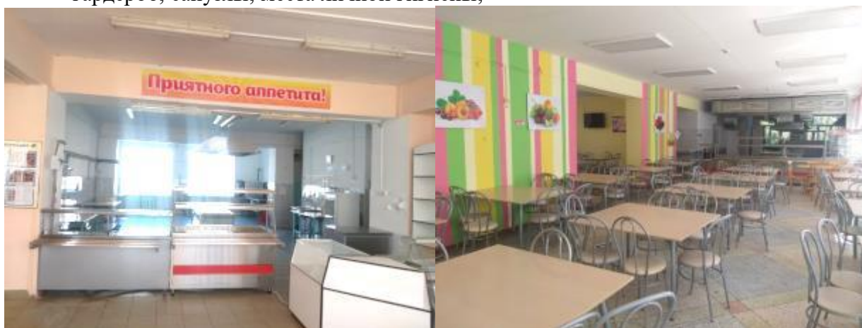
Фото 10. Столовые по ул. Гагарина, 21 и ул. Леваневского, 21