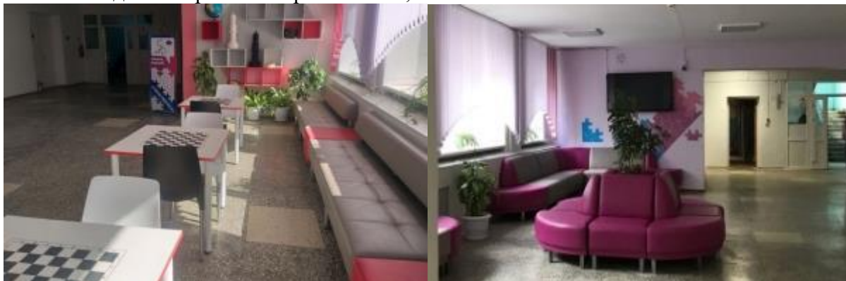
Фото 19, Фойе гимназии по ул. Гагарина, 21