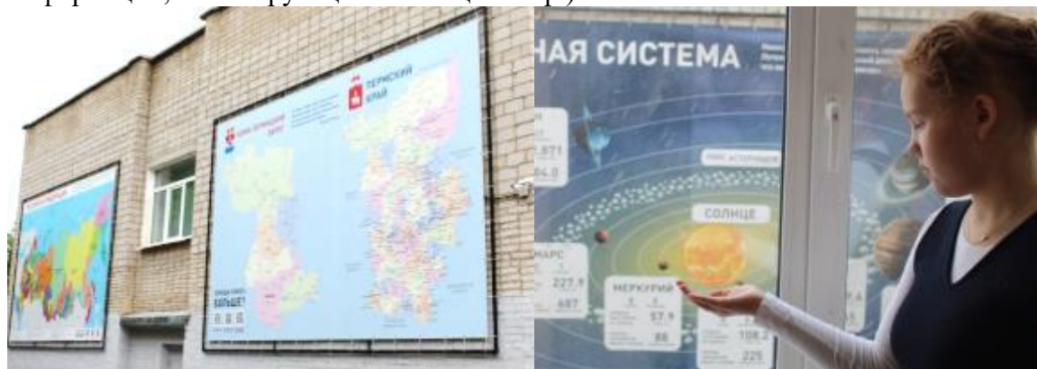
Фото 22. Стены гимназии «Большой атлас» и «Солнечная система»

Оформление помещений гимназии соответствует действующим санитарным нормам и правилам, рекомендациям по обеспечению эргономики, а также максимально способствует реализации интеллектуальных, творческих и иных способностей и замыслов обучающихся и педагогических работников (использование различных элементов декора, размещение информационно-справочной информации, мотивирующая навигация и пр.).