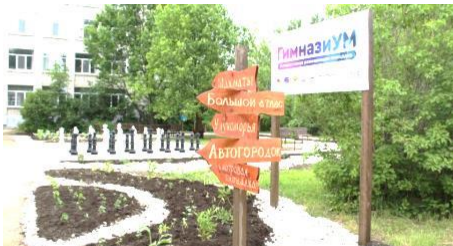
Фото 18. Интерактивная площадка «Гимназиум» по ул. Гагарина, 21