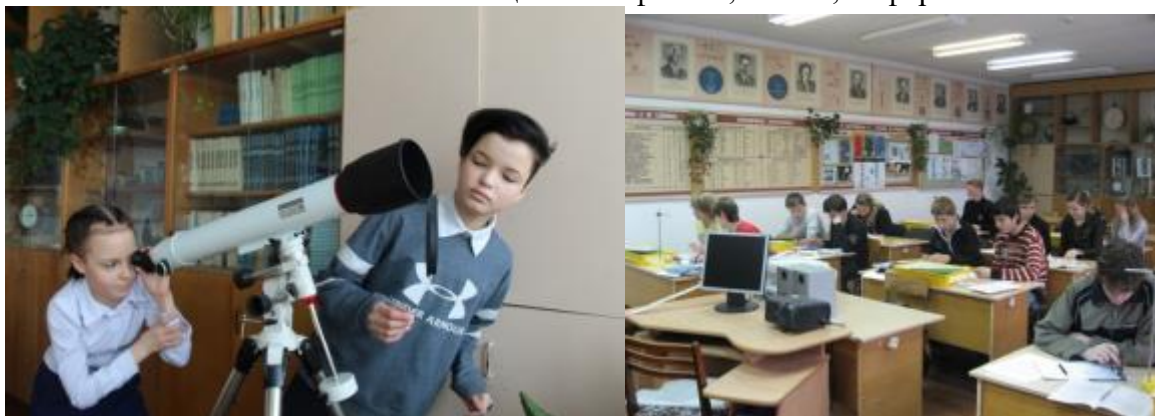
Фото 11. Кабинет физики

-современное диагностическое и лабораторное оборудование для реализации программ профильного уровня по химии и биологии