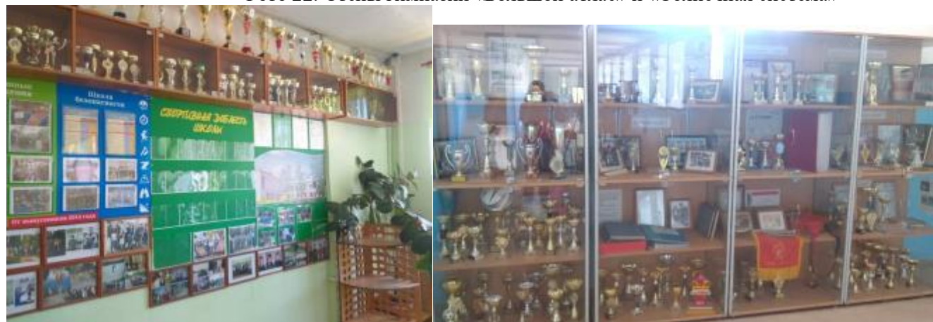
Фото 23. Спортивный стенд по ул. Леваневского,21 и школьный музей по ул. Гагарина,21

Все помещения обеспечены комплектами оборудования для реализации предметных областей и внеурочной деятельности: