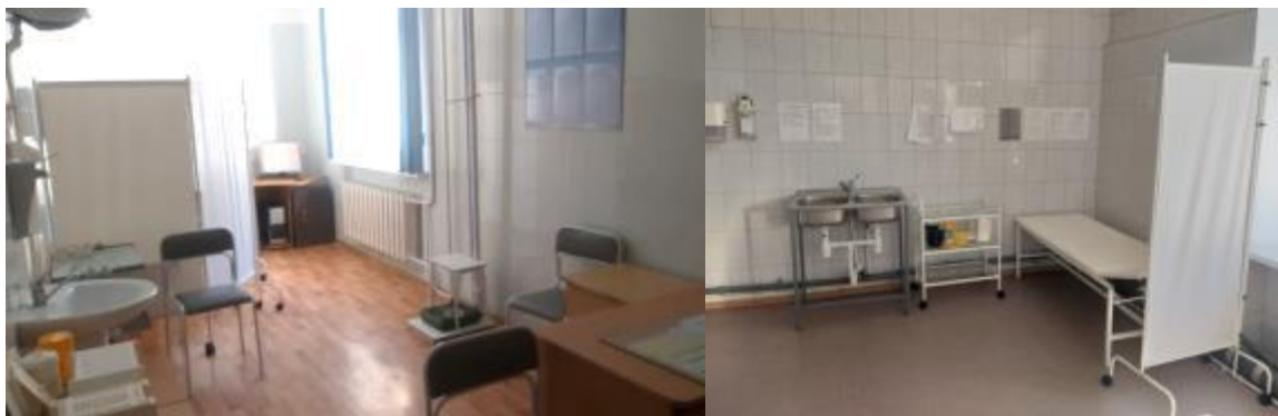
Фото 9. Медицинские кабинеты по ул. Гагарина, 21 и ул. Леваневского, 21