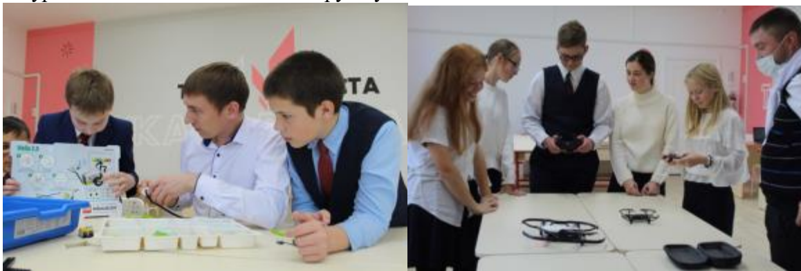
Фото 1. Кабинет «Точка роста»