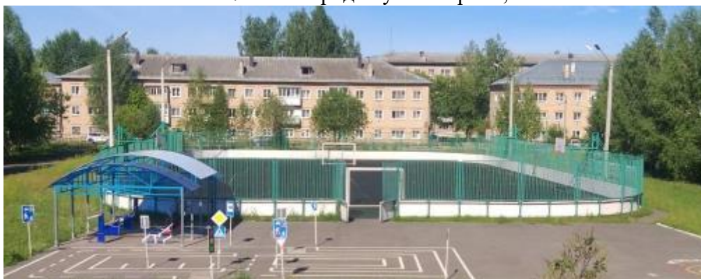
Фото 8. Спортивный стадион, тренажеры ул. Гагарина,21