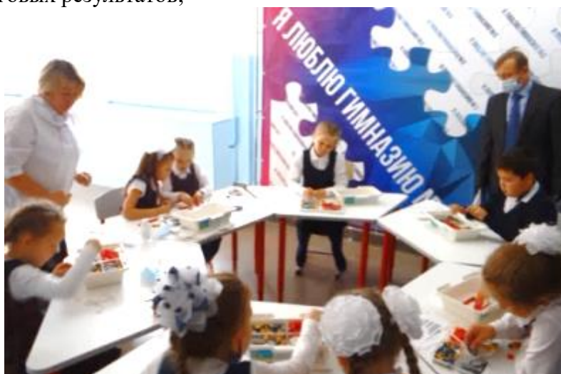
Фото 16 . Занятия по робототехнике во 2-х классах

– индивидуальную и групповую деятельность, планирование образовательной деятельности, фиксацию его реализации в целом и на отдельных этапах, выявление и фиксирование динамики промежуточных и итоговых результатов;