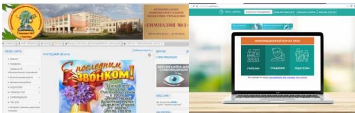
Фото 24.Официальный сайт гимназии и система ЭПОС.Школа

Вся информация о деятельности в гимназии размещена на официальном сайте http://gimnazia-3.ru/ , так же имеется официальная группа в социальной сети в ВКонтakte «Гимназия № 3 – классная работа с 1989 года» https://vk.com/gimnaziakud , группа в мессенджере «Инстаграм». По муниципальному заданию в гимназии электронными дневниками обеспечены 100 % учащихся. Электронные журналы в гимназии с 1 сентября 2020 года ведутся во всех классах в системе ЭПОС.Школа