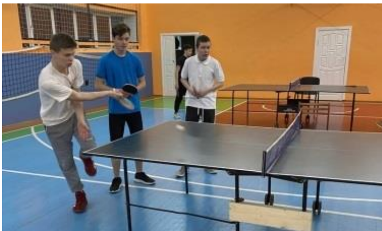
Фото 5. Теннисные столы.