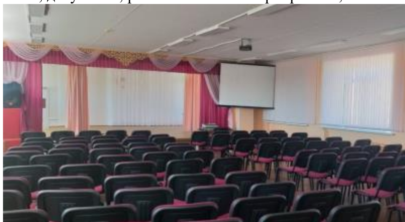
Фото 3. Актовый зал

– multifunctional hall (4th floor) for conducting information-methodological, educational, as well as mass, leisure, entertainment events;