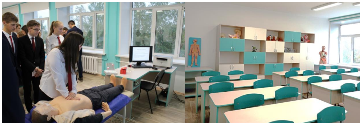
Фото 12. Кабинет биологии. Симулятор для отработки навыков не прямого массажа сердца. Материально-техническое оснащение обеспечивает следующие ключевые возможности:

– проектную и исследовательскую деятельность обучающихся, проведение наблюдений и экспериментов (в т.ч. с использованием традиционного и цифрового лабораторного оборудования по медицине, ЭОР по всем профилям);