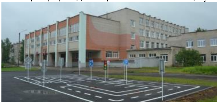
Фото7. Автогородок ул. Гагарина,21