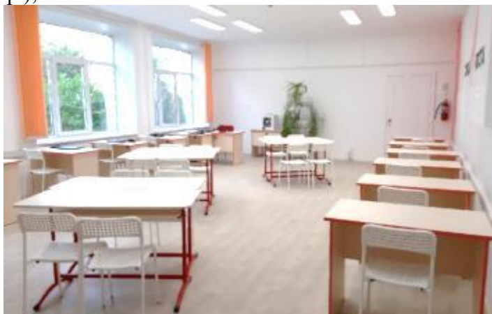
Фото 20. Кабинет технологии по ул. Гагарина, 21