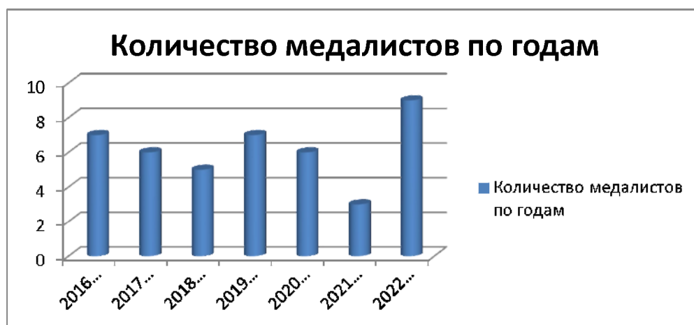
Диаграмма получения медалей выпускниками за последние семь лет.

В 2023 году 8 из 9 «медалистов» набрали по трём экзаменам «225 баллов и выше».