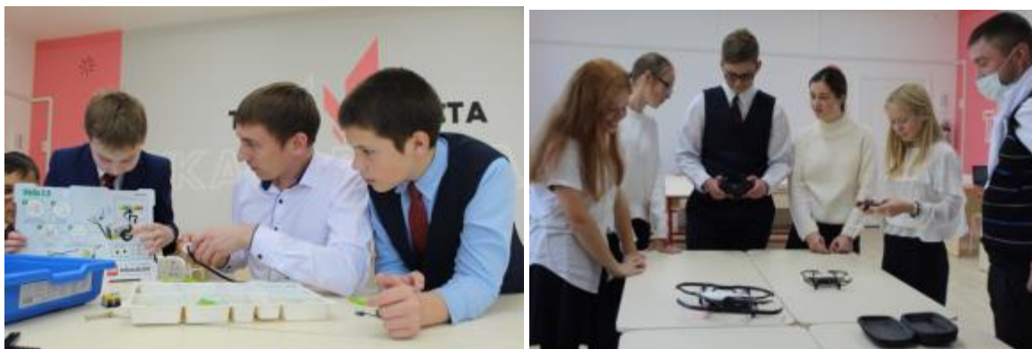
Фото 1. Кабинет «Точка роста»