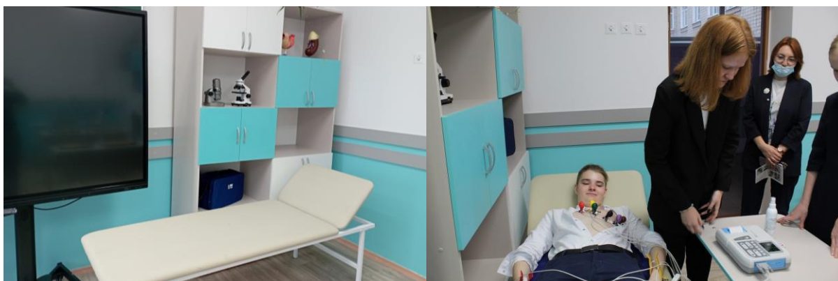
Фото 13. Кабинет медицины. Учебный кардиограф.

– проектную и исследовательскую деятельность обучающихся, проведение наблюдений и экспериментов (в т.ч. с использованием традиционного и цифрового лабораторного оборудования по медицине, ЭОР по всем профилям);