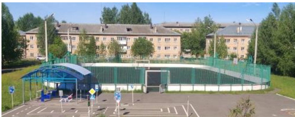
Фото 8. Спортивный стадион, тренажеры ул. Гагарина,21