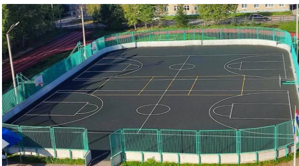
Фото 5. Спортивный стадион и беговая дорожка(2024)