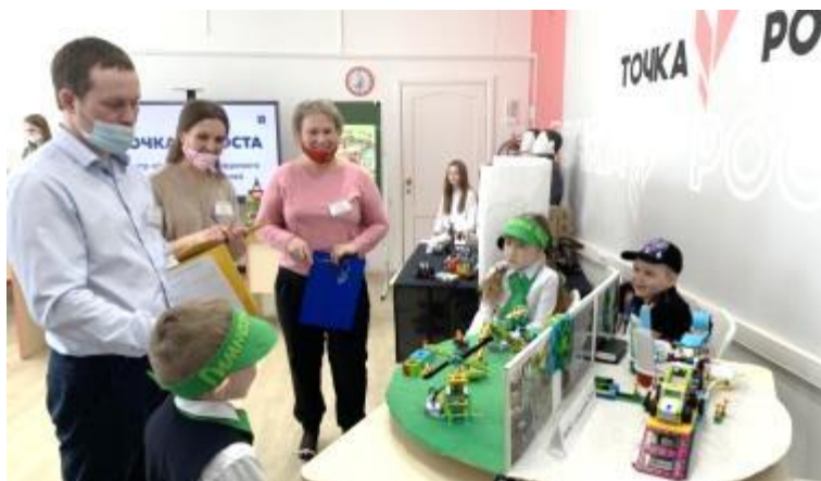
Фото 15. Муниципальный конкурс по робототехнике