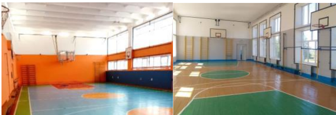
Фото 4. Спортивные залы по ул. Гагарина,21 и ул. Леваневского,21

– 2 спортивных зала, хореографический зал, спортивный стадион, уличные тренажеры и автогородок;