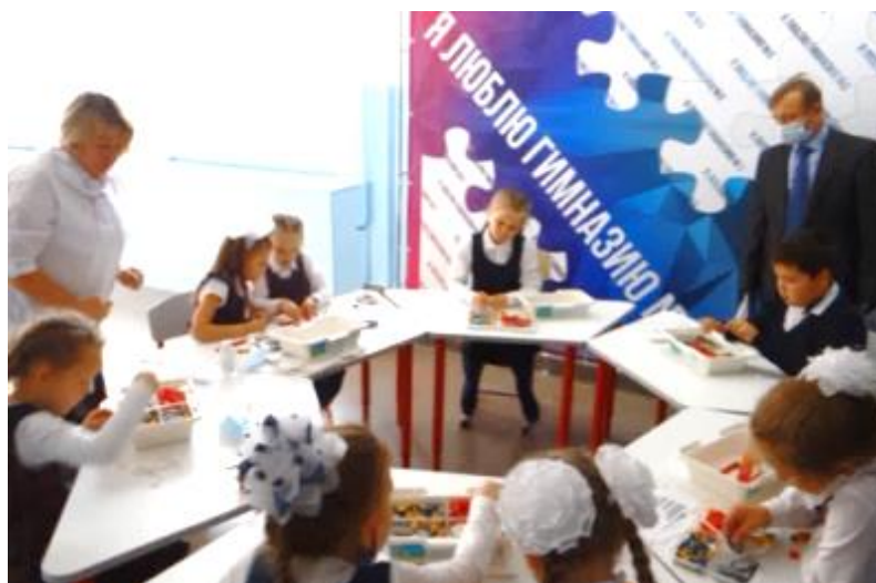
Фото 16 . Занятия по робототехнике во 2-х классах