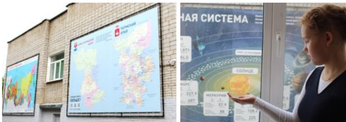
Фото 22. Стены гимназии «Большой атлас» и «Солнечная система»

Оформление помещений гимназии соответствует действующим санитарным нормам и правилам, рекомендациям по обеспечению эргономики, а также максимально способствует реализации интеллектуальных, творческих и иных способностей и замыслов обучающихся и педагогических работников (использование различных элементов декора, размещение информационно-справочной информации, мотивирующая навигация и пр.).