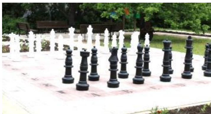
Фото 21. Уличная шахматная зона