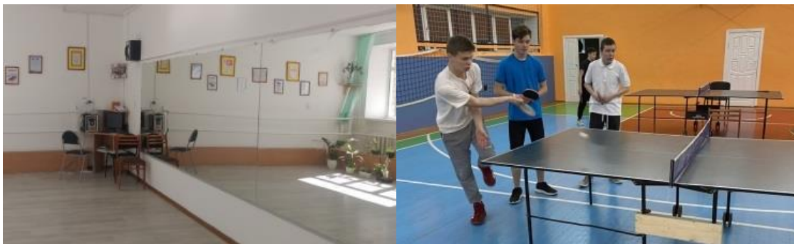
Фото 6. Кабинет хореографии для спортивных бальных танцев. Теннисные столы в спортивном зале. ул. Гагарина,21