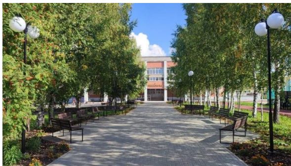
Фото 25. Школьная аллея

В 2024 году полностью отремонтирован школьный двор по ул. Гагарина, 21. по краевой программе «Комфортный край».