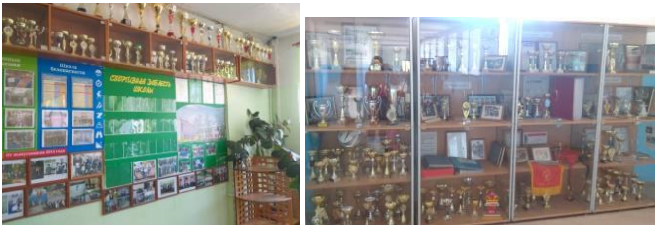
Фото 23. Спортивный стенд по ул. Леваневского,21 и школьный музей по ул. Гагарина,21