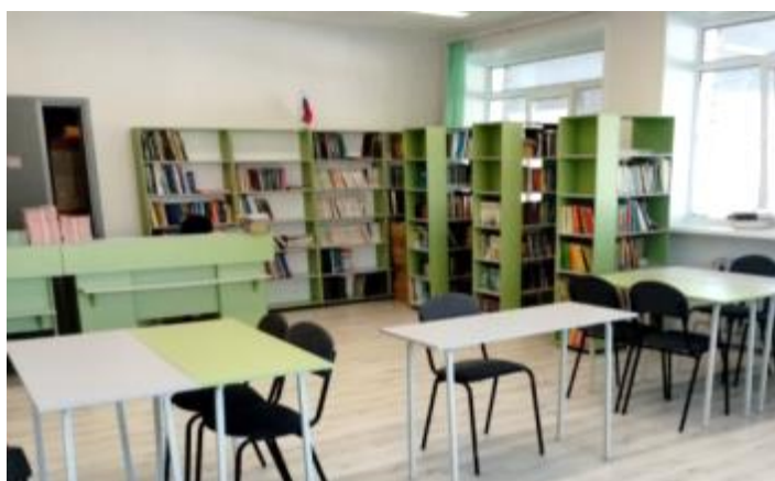
Фото 2. Информационно-библиотечный центр по ул. Гагарина,21