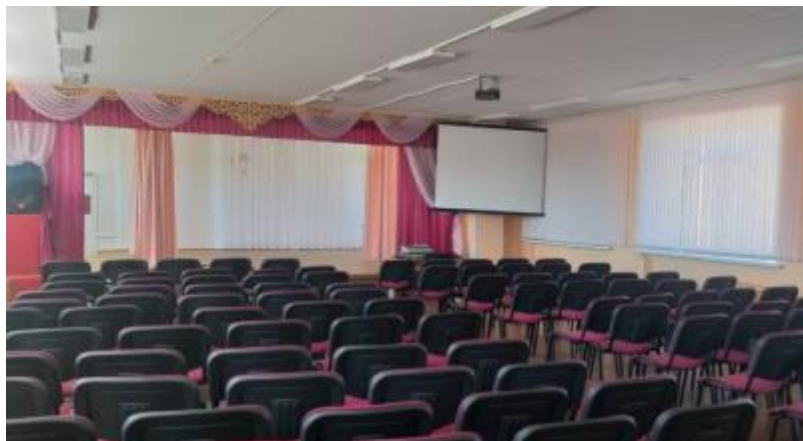
Фото 3. Актовый зал

– мультифункциональный актовый зал (4 этаж) для проведения информационно-методических, учебных, а также массовых, досуговых, развлекательных мероприятий;