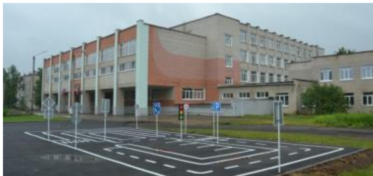
Фото 7. Автогородок ул. Гагарина,21