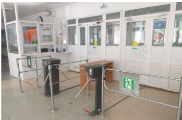
Фото 25. СКУД по ул. Гагарина,21

Материально-технические условия реализации основной образовательной программы гимназии обеспечивают соблюдение санитарно-эпидемиологических требований образовательного процесса, требований к социально-бытовым условиям; требований пожарной и электробезопасности; требований охраны здоровья обучающихся, инвалидов, детей-инвалидов, детей с ОВЗ и охраны труда работников образовательных учреждений; требований к организации безопасности по антитеррору.