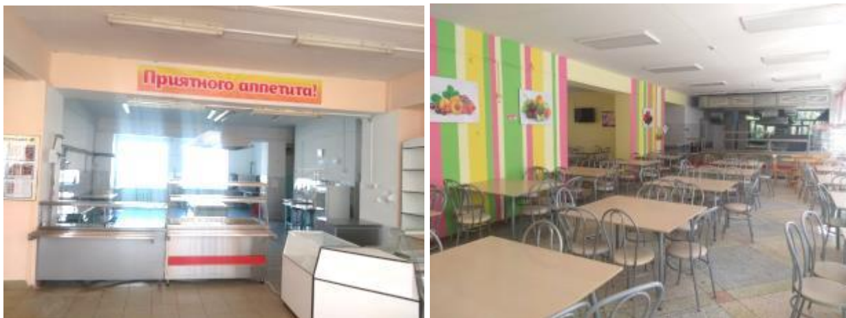
Фото 10. Столовые по ул. Гагарина,21 и ул. Леваневского,21