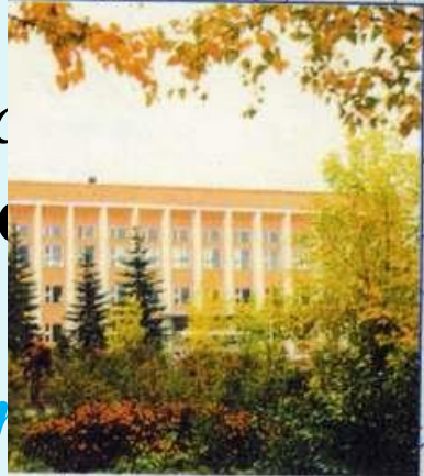
Здание администрации КПАО