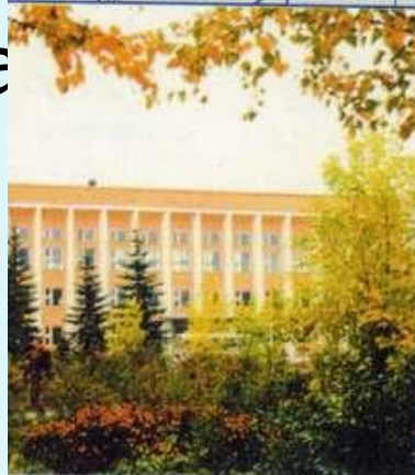
Здание администрации КПАО